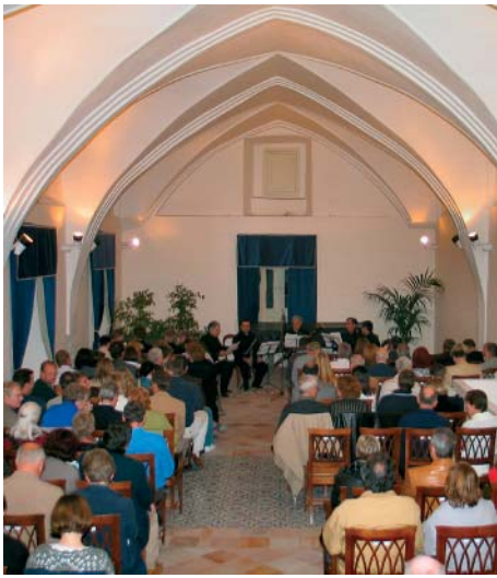
Ravello: Concerto nelle sale di Villa Rufolo