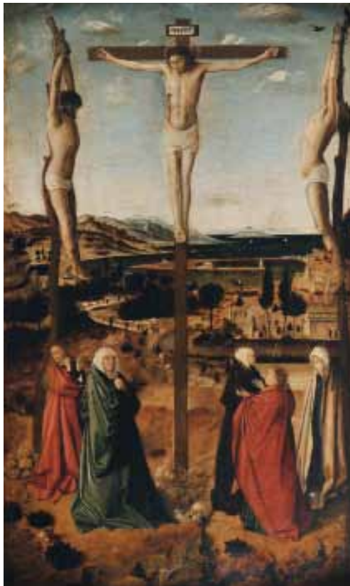
Antonello da Messina Crocifissione 1465-1470 circa Sibiu, Muzeul National Brukenthal

nel rapporto tra la figura del monaco inginocchiato di El Greco e quello di Manet, lo strazio dell'Erodiade di Francesco Cairo, lo strepitoso e teatralissimo martirio di Sant'Andrea di Ribera, la stessa immagine del San Girolamo di Jacopo Bellini ed El Greco. Insomma, un passare in rassegna, attraverso quadri indimenticabili, il più riposto, e talvolta però esibito, senso della vita.