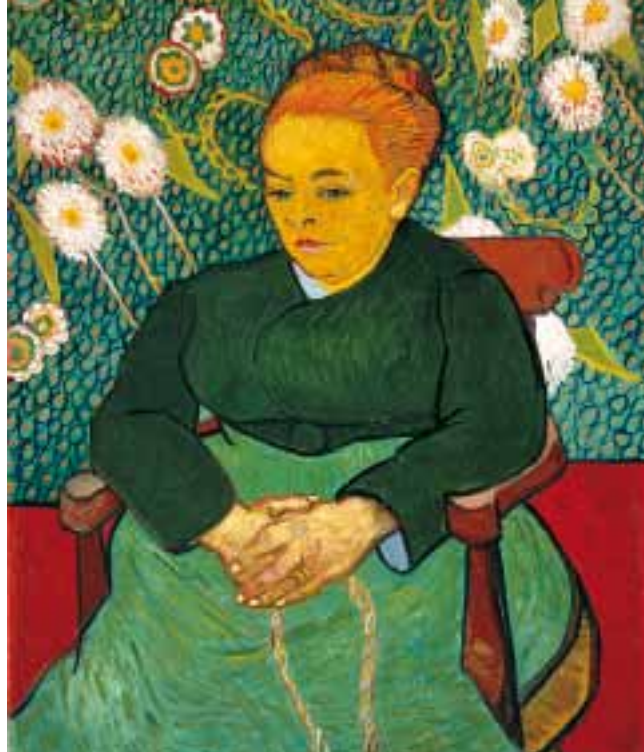
Vincent van Gogh Madame Roulin (La Berceuse) , 1889 Boston, Museum of Fine Arts lascito di John T. Spaulding

rompente è rappresentata da Picasso, autentico punto di svolta e assieme ponte verso quel gruppo di artisti straordinari che chiudono il percorso espositivo. A cominciare da Giacometti e Bacon. Da qui, con ulteriore scarto, prosegue Lucian Freud, nell'ostensione di altri corpi che si offrono a una visione stupefatta e intrigata, per giungere infine all'altissima linea di figurazione, rappresentata da pittori stretti dentro l'assoluto dell'immagine e del sogno come Balthus, Wyeth e López García.