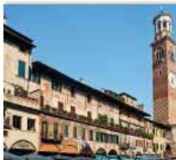
Foto Archivio Provincia di Verona Turismo - Thilo Weimar In alto: foto Alessandro Poletti

stisada de caval , lo stracotto di carne equina, accompagnata dalla polenta fumante, che deve la sua origine alla battaglia tra gli eserciti di Odoacre , principe degli Eruli, e di Teodorico , alla testa degli Ostrogoti. In questo cruentissimo scontro trovarono la morte anche moltissimi cavalli. Per non sprecare tanta abbondanza in tempi di guerre e carestie, la popolazione, tagliata la carne in pezzi, la mise a macerare nel vino, oggi Amarone, e spezie. La tavola veronese offre anche tantissime altre leccornie, quali ad esempio la soppresa, gli gnocchi di patate, il formaggio Monte Veronese, e, tra i dolci, l'ofella, il pandoro, gli zaletti... Lasciatevi tentare!