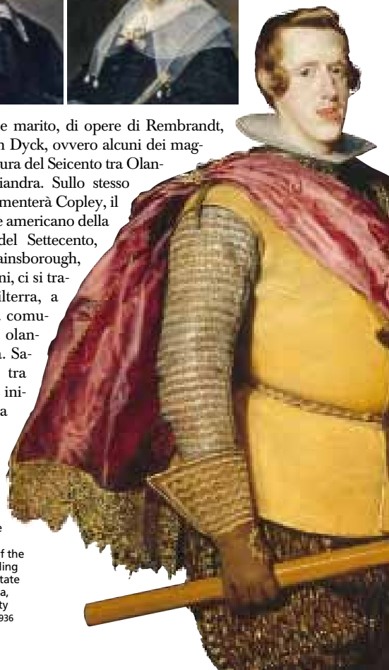
Diego Rodríguez de Silva y Velázquez Filippo IV, re di Spagna, particolare 1625-1635 circa Sarasota, Collection of the John and Mable Ringling Museum of Art, the State Art Museum of Florida, Florida State University lascito di John Ringling, 1936

tema di moglie e marito, di opere di Rembrandt, Frans Hals e Van Dyck, ovvero alcuni dei maggiori pittori di figura del Seicento tra Olanda e terra di Fiandra. Sullo stesso soggetto poi si cimenterà Copley, il principale pittore americano della seconda metà del Settecento, mentre con Gainsborough, nei medesimi anni, ci si trasferirà in Inghilterra, a comprendere la comune derivazione olandese seicentesca. Sarà poi Sargent, tra fine Ottocento e inizio Novecento, a chiudere questo cerchio.