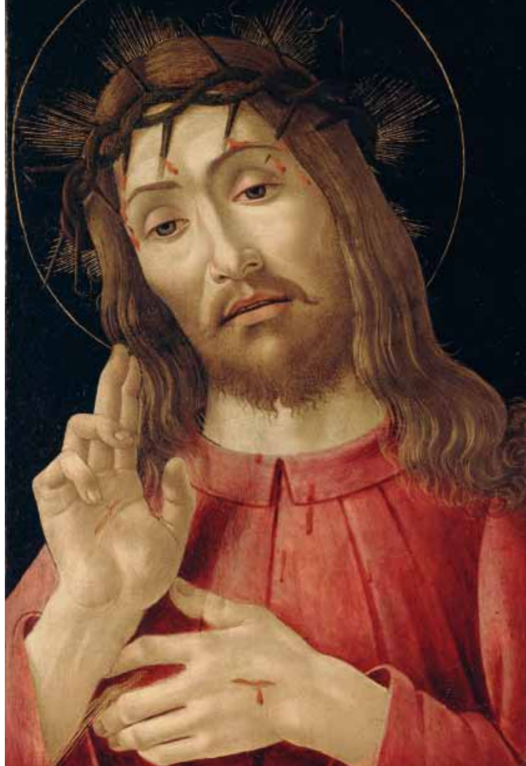
Sandro Botticelli Cristo risorto 1480 circa Detroit Institute of Arts dono di Wilhelm R. Valentiner