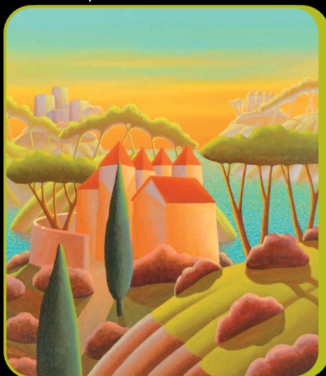
LA GIOIA DELLA VITA... - cm 60x70

Gli è stata inoltre commissionata la realizzazione di un altro mosaico per la stazione metropolitana di Fiumicino. Dal 1996 l'artista è presente su alcune navi da crociera della flotta Royal Caribbean Cruise di Miami con opere di grandi dimensioni a testimoniare l'importanza dei viaggi quale continua fonte di osservazione ed ispirazione per le sue opere.