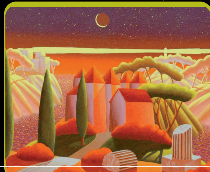
COME LA MIA PASSIONE PER TE...! - cm 60x50

Nello Arionte Consulente e critico d'arte