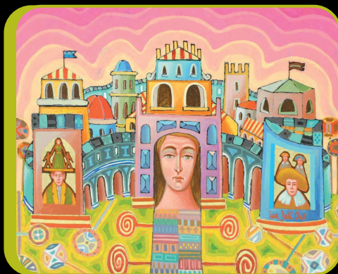
PAESE INCANTATO... - cm 60x70

A Cetara, invece, appaiono come la trasfigurazione pittorica delle infinite suggestioni ed emozioni che questi luoghi regalano a chi ha la fortuna di visitarli. Qui, infatti, come nei fantastici scenari dell'artista, il tempo scorre ancora lento e silenzioso; scandito dai tranquilli ritmi naturali; addolcito dai piaceri della gustosa cucina tradizionale; allietato dal profumo del mare e dei fiori. Qui, dove il sole riscalda il cuore e la luna l'intenerisce, è più facile abbandonarsi ai sentimenti buoni, all'amore... ed alla gioiosa pittura di Luca Dall'Olio, sognando con lui... ad occhi aperti.