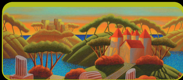
TI VEDO FELICE... - cm 80x40

Ristorante SAN PIETRO tel. 089.261091 www.sanpietroristorante.it