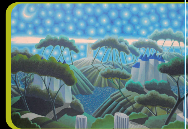
POSSO VEDERE TUTTE LE COSE CHE VOGLIO... - cm 120x80