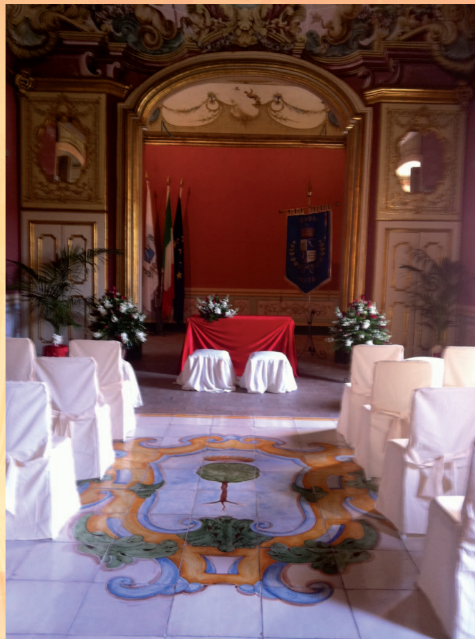
Weddings a Maiori

Per antiche vie - Da San Lazzaro ad Amalfi