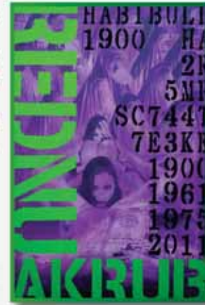
D'AMORE: L'enigma della memoria The enigma of memory