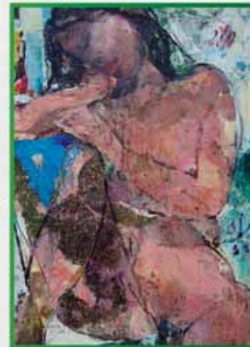
TROTTI: Ricordare con l'anima Reminding through the soul