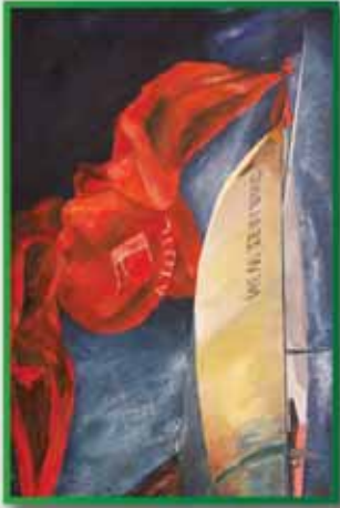
TOMASSOLI: L'eco del mare The echo of the sea