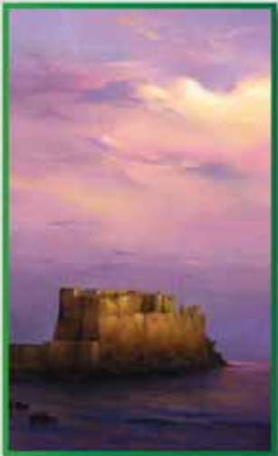
PETITO: Memorie di paesaggi Memories of landscapes