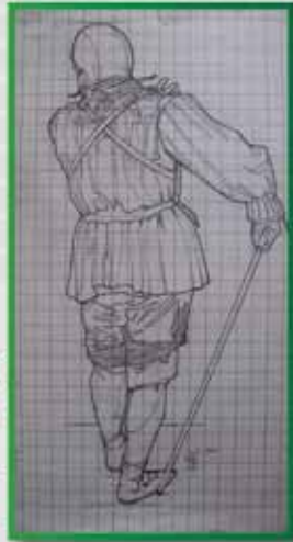
BATTINI: I segreti dell' arte antica The secrets of ancient art