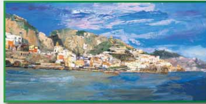
BINI: Reminiscenze di città Recollections of towns